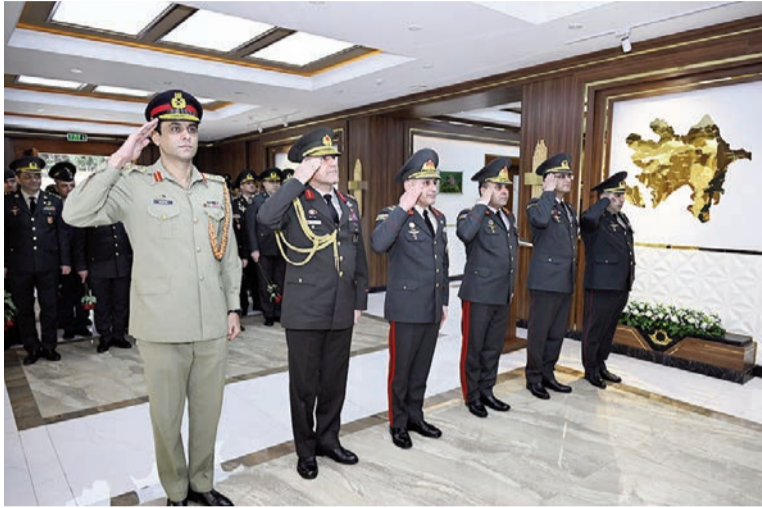
Milli Müdafiə Universitetinin (MMU) tabeliyində fəaliyyət göstərən Cəmşid Naxçıvanski adına Hərbi Liseyde “Strateji araşdırmalar və dövlət müdafiəsini idarəetmə akademik

kursu”nun (SADMİAK) 28-ci buraxılış mərasimi keçirilib.